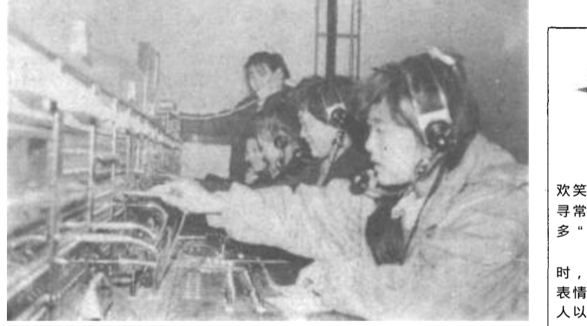
河口区邮电局话务班积极开展优质服务竞赛活动，被授予“明星话务班”称号。图为话务员们正在紧张地工作。

本报讯 为提高我市基层计划生育通讯报道及摄影人员的业务水平，3月5日至11日市计生委举办了首期42人参加的新闻写作及摄影培训班。聘请有关新闻单位的编辑讲授了新闻写作、新闻摄影基础知识。（赵光华 胥华远）