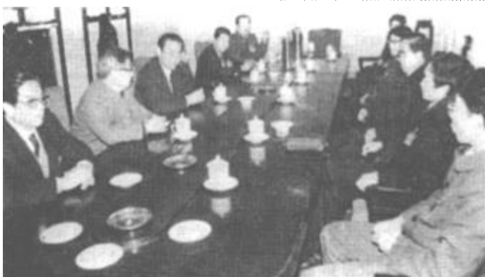
△ 出席市政协二届五次会议的政协委员们分组讨论李殿魁市长作的政府工作报告,大家畅所欲言,共商加快改革开放的大计。

代表和委员们还认为,李殿魁市长在报告中紧紧围绕实现第二步战略目标的总要求,认真分析了市情,客观地找出了制约我市经济发展的主要环节,提出了全面开发黄河三角洲,实现对外开放的新思路,制定的措施也切实可行,这对于我市继续深化改革,扩大对外开放和黄河三角洲大开发、石油化工大发