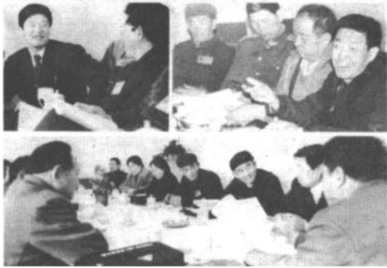
△ 出席市二届人大五次会议的的代表，认真审议李殿魁市长所作的政府工作报告。

（三）加快对外开放步伐，大力发展外向型经济。第一，要主动出击，广辟对外合作渠道。第二，要以国际市场为导向，大力调整出口商品结构。第三，要发挥我市资源和区位优势，正确选择突破口，扩大对外开放。第四，要抓住有利时机，努力做好工作，争取国家尽快把我市列为沿海经济开放区。